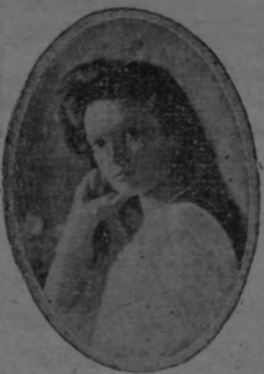
LA PRINCESA OLGA

Arresto de Kiamil Bajá.-- Visita de Zeppelin.-- La cuestión balcánica